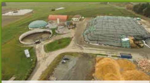
14 Biogasanlage Meierhof Meierhof 70, Münchberg