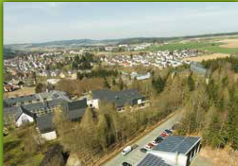
10 Heizwerk Christusbruderschaft Wildenberg 23, Selbitz