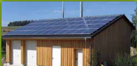
22 Satellitenkraftwerk Breitenbrunn Am Luxbach, Breitenbrunn/Wunsiedel