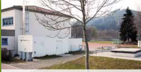
4 Biomasseheizwerk Pressig Hauptstraße 8, Pressig