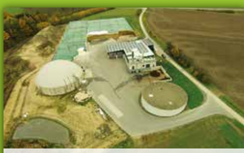
7 Biogasanlage Schmölz nähe Lerchenhof, Schmölz bei Küps