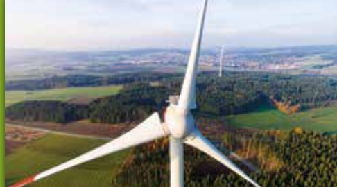
12 Windräder Weidesgrün zwischen Selbitz und Marlesreuth