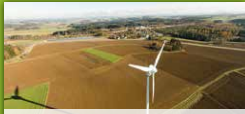
11 Bürgerwindrad Sellanger Grenzenberg, Sellanger/Selbitz