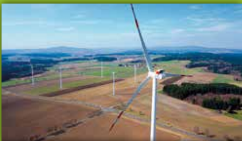
21 Windpark Braunersgrün An der St2176 zwischen Stemmasgrün und Braunersgrün