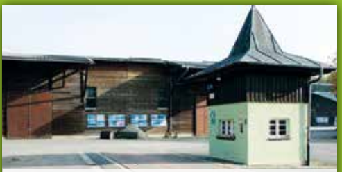
33 Landwirtschaftliche Lehranstalten Bayreuth Adolf-Wächter-Straße 39, Bayreuth