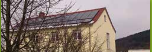
30 Bürger-PV-Anlage Bad Berneck Adalbert-Stifter-Weg 14, Bad Berneck