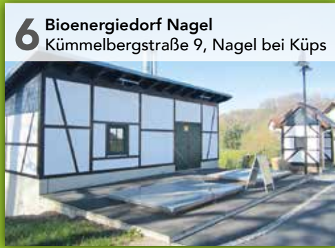
6 Bioenergiedorf Nagel Kümmelbergstraße 9, Nagel bei Küps