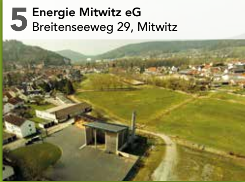
5 Energie Mitwitz eG Breitenseeweg 29, Mitwitz