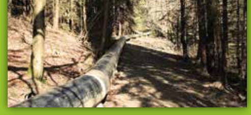
27 Schwallwasserkraftanlage Gefrees-Kornbach An der St2180 zwischen Gefrees und Knopfhammer