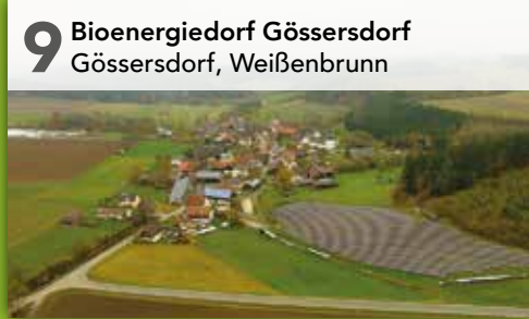
9 Bioenergiedorf Gössersdorf Gössersdorf, Weißenbrunn