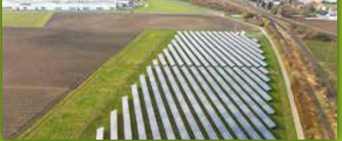
34 Bürgerenergie Speichersdorf Rathausplatz 1, Speichersdorf (Infopoint)