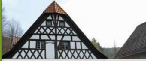
8 Rothmühle Weißenbrunn Grüner Straße 7, Weißenbrunn