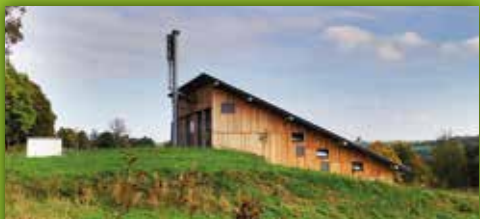
23 Satellitenkraftwerk Schönbrunn Neben Bayreuther Str. 1, Schönbrunn bei Wunsiedel