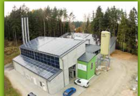
24 Biomasseheizwerk Luisenburgallee (oberh. Markgrafenstr. 30), Bad Alexandersbad