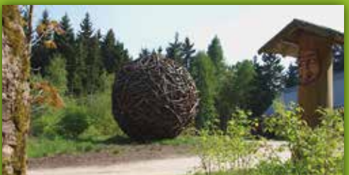
32 Waldhaus Mehlmeisel Waldhausstraße 100, Mehlmeisel