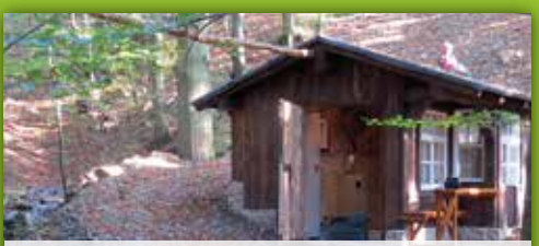
31 Wasserkraftanlage Wurzbach-Warmensteinach An der St2181 Abzw. Zainhammer rechts