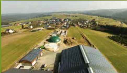
3 Bioenergiedorf Effelter Effelter 81, Wilhelmsthal