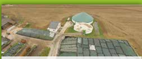
13 Bioenergiedorf Neudorf Neudorf 90, Schauenstein