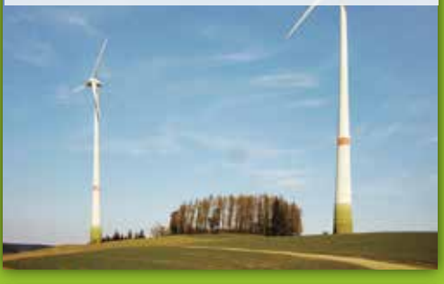
29 Windkraftanlage Lützenreuth Wirtschaftsweg hinter Lützenreuth 29, Gefrees