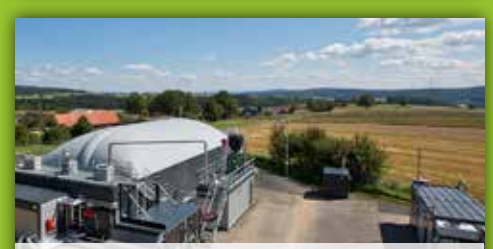
25 Biogastiger Bergnersreuth An der St 2176 Ortsausfahrt Bergnersreuth Richtung Arzberg rechts