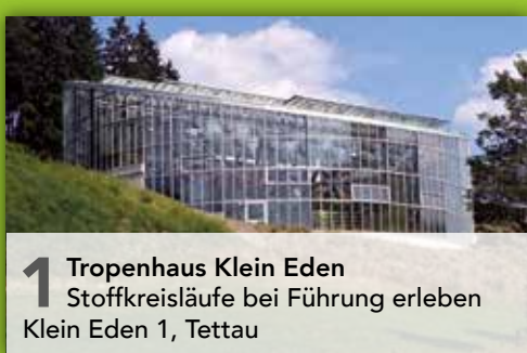
1 Tropenhaus Klein Eden Stoffkreisläufe bei Führung erleben Klein Eden 1, Tettau