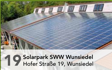
19 Solarpark SWW Wunsiedel Hofer Straße 19, Wunsiedel