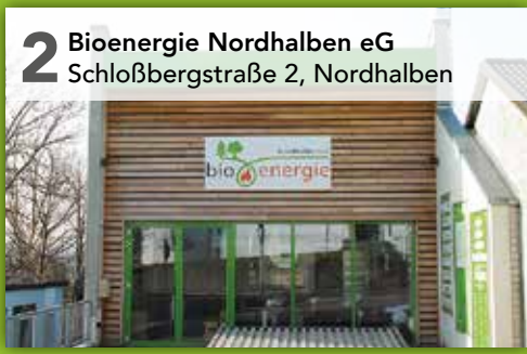
2 Bioenergie Nordhalben eG Schloßbergstraße 2, Nordhalben