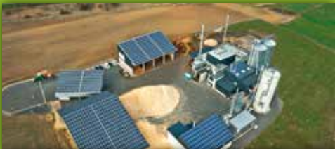
20 Biomasse-Heizkraftwerk Hohenbrunn mit Pelletwerk Am Energiepark 1, (Wintersreuther Str.), Hohenbrunn bei Wunsiedel