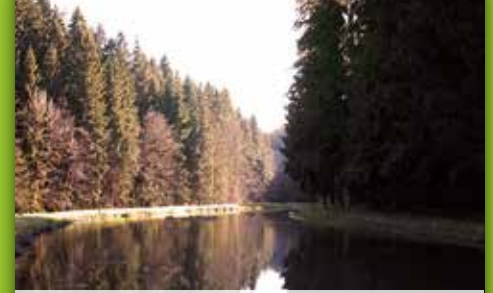
28 Wasserkraftwerk Entenmühle Entenmühle 6, Gefrees