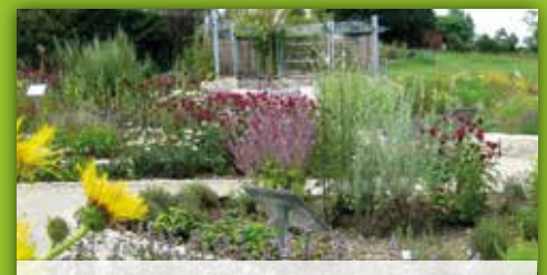
26 Kräuterhaus Nagel Kemnather, Str. 3 Nagel